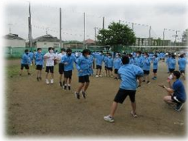
うんどうかいれんしゅう ようす <運動会練習の様子>