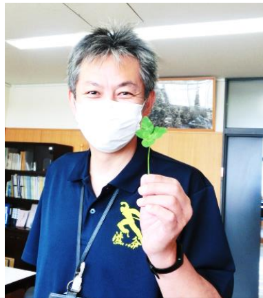
うんどうかいあさ じゅんびじ こうちよう 運動会朝の準備時に、校長 せんせい よ 先生は四つ葉のクローバー をゲットしました。 よ いちにち かくしん 良い一日になると確信!