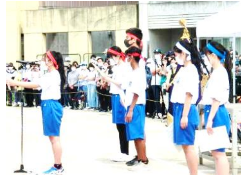
かいかいしき 開会式では、6か国語で国際色豊 にスピーチを行いました。