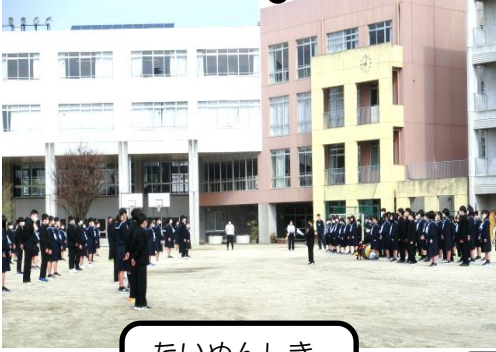
たいめんしき 対面式