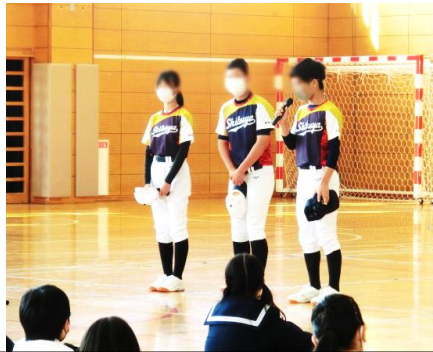
ぶかつどう 部活動オリエンテーション