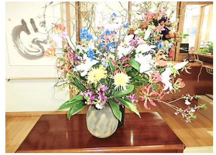
かどう ぶにゅうがくしききょうきょうどうさくひん 華道部入学式用 共同作品

がつむい か あたた はるかぜ なか めい しんにゅうせい むか だい かいにゅうがくしき きょうこう れいわ 4月6日、暖かい春風の中100名の新生を迎え、第77回入学式を挙行し、令和 5年度の渋谷中学校がスタートいたしました。