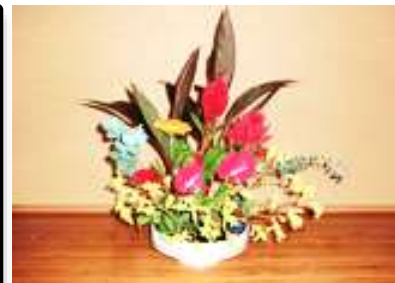
かどうぶいんきくひん 華道部員作品