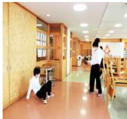
<映像写真の撮り方・かっこいい 立ち方・歩き方の基本を学ぶ>