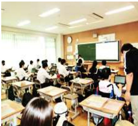
<キーボードレッスンと 表計算を学ぼう>