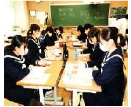
<缶バッチ制作でデザイナーの体験をしよう>