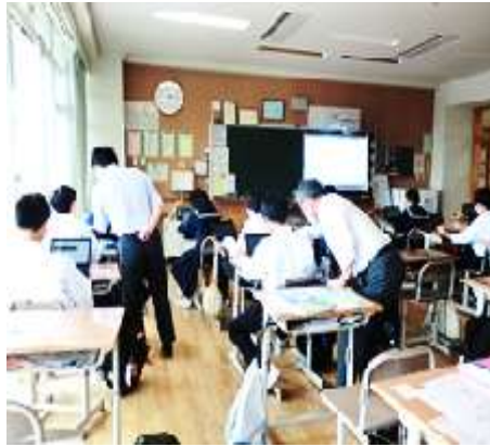
<情報の学習を体験しよう>