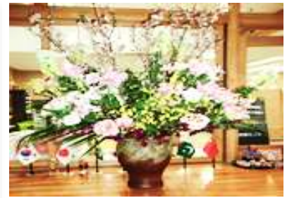
そつぎょうしき だんじり かなざ せいしか 卒業式の壇上に飾った生花

本日(ほんじつ)を以(も)ちまして、令和(れいわ)5年度(ねんど)の教育課程(きょういくかてい)が修了(しゅうりょう)となります。保護者(ほごしや)の皆様(みなさま)、そして地域関係者(ちいきかんけいしや)の皆様(みなさま)には生徒(せいと)たちを常(つね)に温(あたた)かく見守(みまも)り、支(さ)えてくださり感謝(かんしやもう)申し上げます。生徒(せいと)たちは春休(はるやす)みとなりますので、新年度(しんねんど)に向けての準備(じゆんび)や地域(ちいき)での活動(かつどう)も活発(かつぱつ)になると予想(よそう)します。今後(こんご)もお力添(ちからぞ)えを頂(いた)ぎ、生徒(せいと)を学校(がっこう)と地域(ちいき)で育(ち)んでいく所存(しよぞん)でございます。どうぞよろしくお願(ねが)い申し上げます。