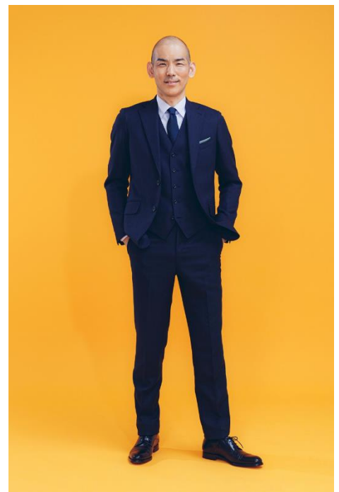
木山 裕策 氏

1968年10月3日生まれ。大阪府出身 2005年に甲状腺がんの手術を行った際、医師から「手術後に声が出なくなる危険がある」と告げられ、長年の夢だった歌手へ挑戦を決意する。 2008年2月6日に家族をテーマにした楽曲「home」でメジャーデビュー。2008同年『第59回 NHK 紅白歌合戦』に初出場を果たす。その後も4人の子どもを育てながら、会社員と歌手の二足のわらじの生活を続けるが、2019年12月から歌手生活に専念。現在は歌手生活と講演活動を中心とした生活を送っている。