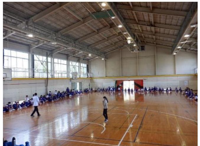
〈バースデーラインの様子〉

中学校生活に最初は不安がありました。友達関係で、新しい友達ができるのか、仲の良かった友達は関係はくずれるのかなど、不安でした。けれど中学校に入学していろいろな人と話し合えることができました。仲の良かった友達とクラスは、はなれてしまったけれど、そのおかげでいろいろな友達と、より仲が深まったので、よかったと思います。まだまだ分からないことがあるけれど、友達と協力し合い、助け合いで乗り越えられればなと思います。