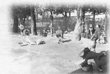
みんな一生懸命に、気持ちよく取り組んでくれています！