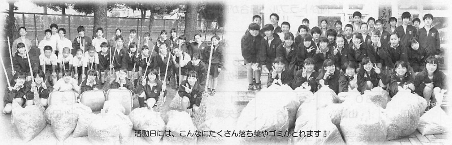
活動日には、こんなにたくさん落ち葉やゴミがとれます！

もうすでにお子様から聞いていると思いますが、ボランティア部ではペットボトルとプランタでオクラとイチゴを育て始めました。また、1、2年昇降口横にプランタでヒマワリも育て始めました。オクラについては8月～9月、イチゴについては来年の5月頃収穫予定です。イチゴについてはまだ根付いていないので、根が張り次第持ち帰らせる予定です。イチゴは乾燥に弱いので、夏場は、少し日陰に置いてあげる事やこまめな水やりが必要になります。持ち帰った際は、お手間をかけますが、宜しくお願い致します。