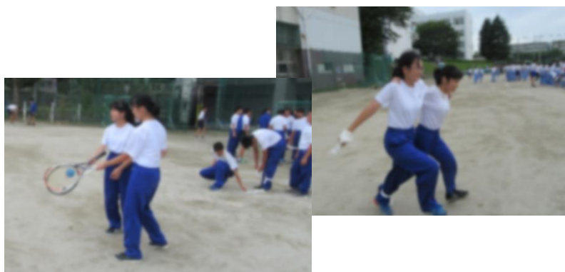
《バラエティーリレーの練習風景》

2年生のクラスでの練習は、初めから協力してできているクラスばかりではありませんでした。しかし、運動会が近づいていく中で、体育委員や中央委員を中心に、クラス全体に声をかけ、集中して練習に取り組む姿も多くみられるようになってきました。