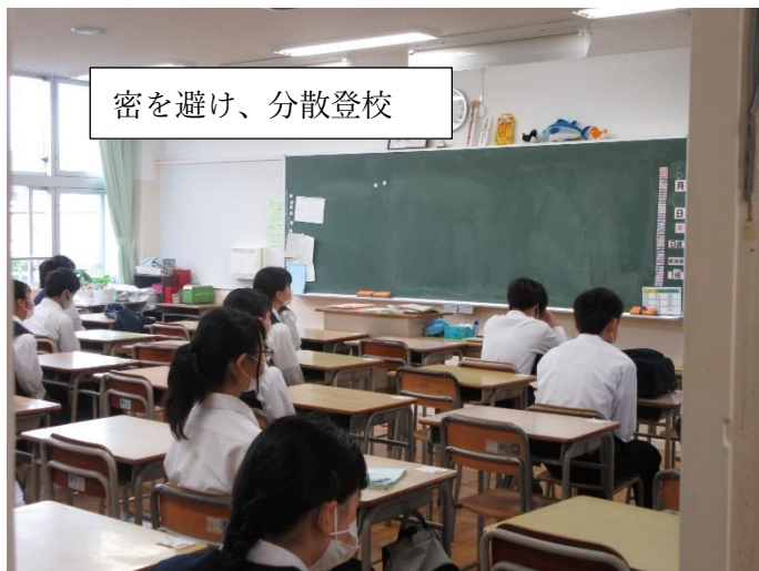
密を避け、分散登校

6月から学校再開するにあたり、学校では生徒の安全安心の取り組みをしています。6月中は分散登校を行い、ゆるやかに再開を図っています。また、学校再開初日は、校長先生の放送によるお話や、担任の先生から新しい生活習慣やエチケット（マスク着用や、ソーシャルディスタンス等）について説明がありました。