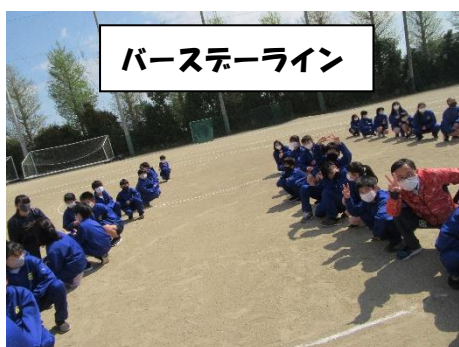
バースデーライン

2校時に行われた『学年レク』ではバースデーライン、ボール送り、猛獣狩りの3つのゲームを楽しみました。バースデーラインは「全員で誕生日順に並ぶ」「その際は言葉を使ってはならない」というゲームです。このゲームはクラス対抗で行いました。答え合わせをしてみると、いくつか間違いがあったクラスがほとんどでしたが、1つだけパーフェクトのクラスがありました。ボール送りのクラス対抗で、1戦目は上・下・上・下の順、2戦目は左・右・左・右の順、とボールの渡し方を変えて行いました。どのクラスもボール送りがとても速く、接戦となったため、順位を見るのが大変でした。猛獣狩りは、リズムに合わせて踊りながら、リーダーが指示した動物の文字数でグループを作りました。文字数は3文字から始めてどんどん増えていき、最後は10文字となりました。その結果、クラス無関係で、知らない人たちともふれあうことができました。グループを作る前の歌と踊りを思いっきり楽しんでいる様子も見られました。