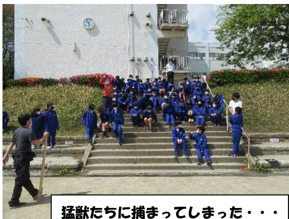
猛獣たちに捕まってしまった・・・