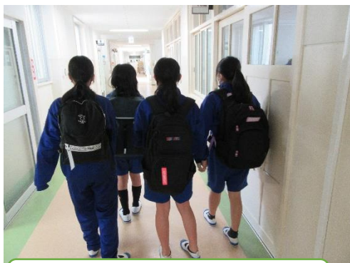
勉強を終えて帰る一年生☆