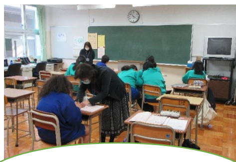
南先生と宮野先生が優しく 丁寧に教えてくれます