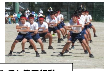
↑3年生によるダンスと集団行動 来年が楽しみですわ！