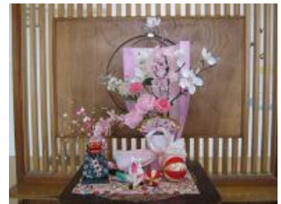
【1月9日：職員玄関にて】

みなさんは、この冬休みを元気にしっかりと過ごせたでしょうか。大きなケガや事故の報告もなく、安心してしています。休み中も、学校内外で、みなさんが意欲的に色々な活動に取り組む姿を見ることができました。部活動や練習試合等もありました。学習会にもみなさんが参加をして、熱心に学習に取り組む姿を見ました。みなさんが、計画的に・充実した17日間の冬休みを過ごすことができたかと安心してしています。