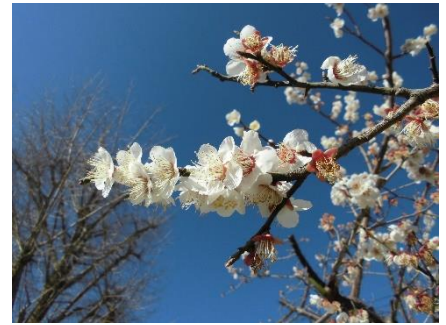
校庭体育倉庫の南側にて