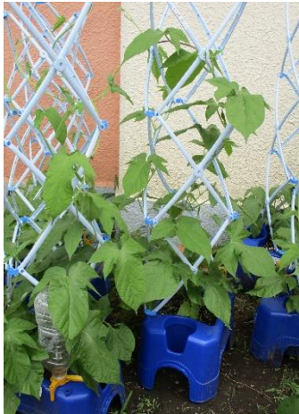
1年生が育てているアサガオ