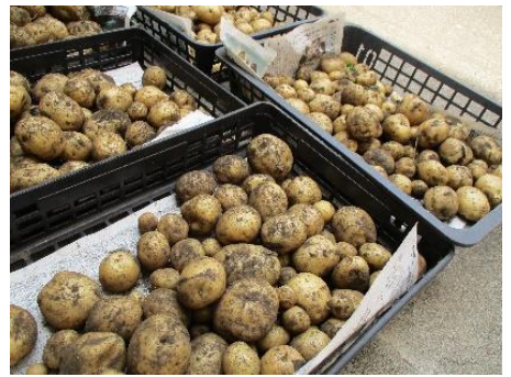
6年生が収穫したジャガイモ

生まれてくるのは、みんな同じ。と思ってたけど、赤ちゃんは色々工夫してがんばって生まれてきたんだなと思いました。さいしょはどうやって生まれてきたんだ？と思ってました。赤ちゃんはどんどん回ってんして生まれたんだと思いました。生まれてくるというとき自分の命も大切。他の人の命も大切。みんなは色々がんばりながら今ここにいるんだと思いました。私はこれから命を大切に平等にしていきたいと思います。・・・(省略)・・・ (4年いのちの授業ふりかえりシートより抜粋)