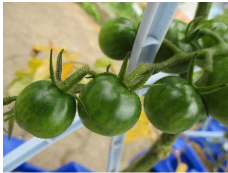
2年生が育てているミニトマト