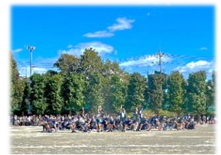
6年 輝け～未来への光～