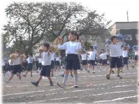
1年 Powerful(パワフル) Smile(スマイル)～92ひきのさかなたち～

子どもたちの生き生きとした演技、どれも素晴らしかったです。保護者の皆様に応援してもらったことが子どもたちにとって、どれだけ励みになったことでしょうか。一人一人最高の笑顔につながったことと思います。今後もどうぞご協力のほどよろしくお願いいたします。