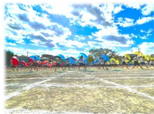
2年 NO RAIN NO RAINBOW