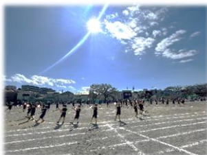
4年 ふくだんちゆめ宝 エイサー～2023～