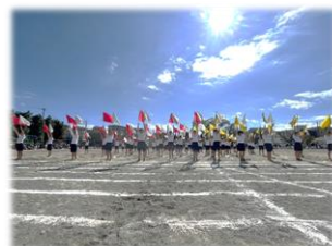
5年 LET'S 5! Flag! ～未来は僕等の手の中に～