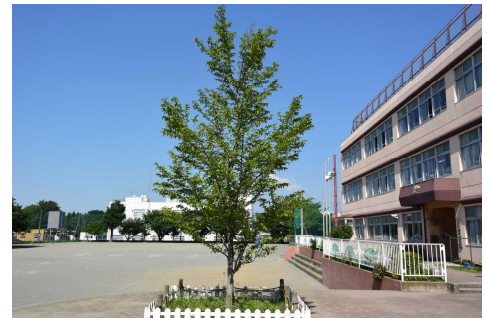
『現在のコブシの木』

コブシの木は、この地域に自生しており、校舎建築の際、ピロティに植樹されたのが、始まりです。（植樹された年月は、はっきりしませんが）2本目のコブシの木は、平成6年1月に引地台公園より校庭の西側に移植されています。また、ピロティのコブシは、平成22年4月に植え替えを行い、2代目となっています。