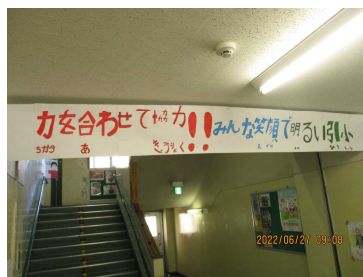
【本年度児童会目標】