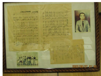
【7月校長から校歌の話】