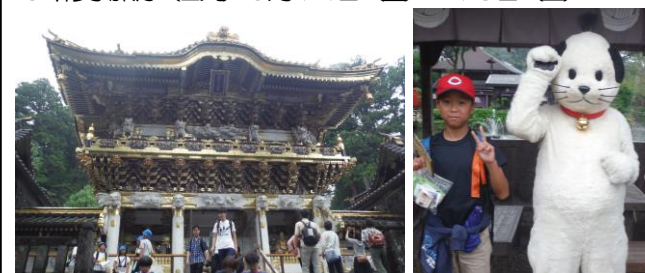
6年修学旅行(日光) 9月14日(金)~15日(土)