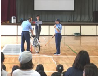
(自転車を使用して危険な行為を実演・指導)

友だちと自転車で外出する機会も増える3年生、交通ルールを再確認し、知らずにやっているかもしれない危険な行為を、子どもたち自身で知るために「交通安全教室」を開催しました。