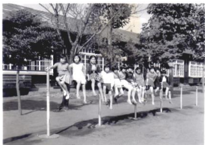
(昭和35年 北大和小学校 校庭にて)