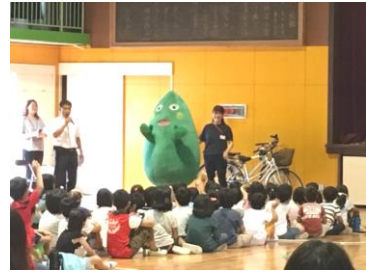
(“やまとん”も参加してくれました)