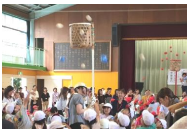
（玉入れの部：大いに盛り上がりました！）

小学校に入学して3か月、子どもたちも学校生活にも慣れ、元気に過ごしている姿をみることができま。例年、親睦会・茶話会として別の時期に開催することが多かった学年行事ですが、今年は、早い段階で情報交換をしながら親睦を深めたいという思いで、7月の開催となりました。