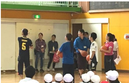
（まずは先生がたのお手本から～）

楽しみに準備を進めてきた修学旅行も無事に終わり、6年生は、残り半年となった小学生生活を、日々満喫しているように思います。そんな子どもたちと保護者が、クラス一丸となって楽しめる時間を！！との思いから、10月15日（月）6学年企画「クラス対抗！フリースロー大会」を実施いたしました。最高学年ならではの盛り上がり、その一つ一つが子どもたちの良き思い出として、心に残る事でしょう。