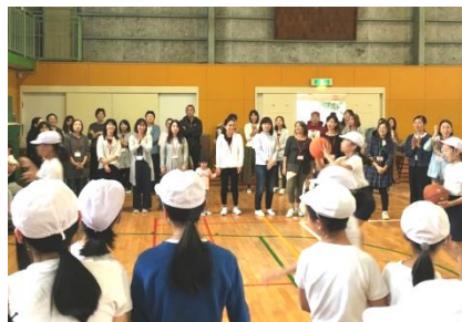
（さすが、真剣かつスピーディー！）