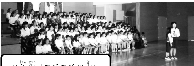
3年生「モチモチの木」