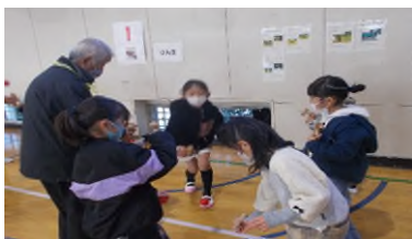
体育委員会主催行事

1月30日(月)に1年生はクラスごとに地域の方に昔遊びを教してもらいました。コマ回しやけん玉、竹とんぼ、ぼっくりなど、初めはうまくできなくてもコツを教えてもらってできるようになると嬉しそうでした。