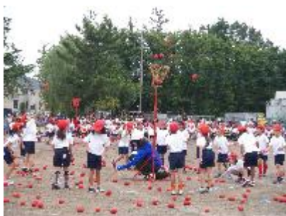
ダンシングたまご(1年)