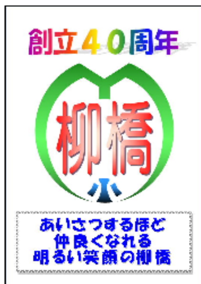
創立40周年ポスター

校内のことだけでなく、日頃、見守り活動をはじめ、いろいろな場面で支えてくださっている地域の方々にも、子どもたちから感謝の気持ちをこめてあいさつができるとういと思います。