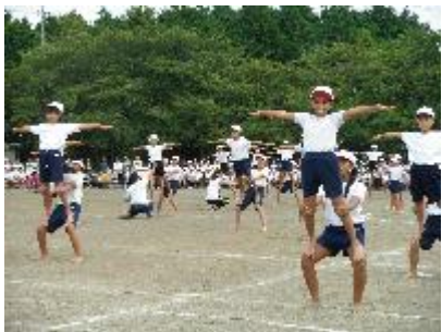
これからの僕たち ～共にあゆもう～(5年)