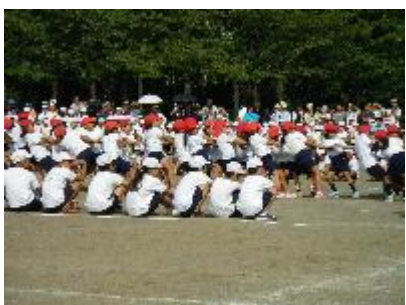
みんなでつなひき(全学年)