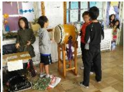
5-3 ものまねショー しゃてき、PK戦、イラストさがし、 たいこでドコド〜ん!!