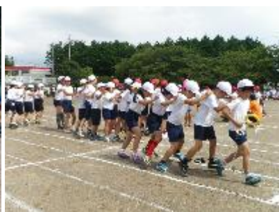
足も心もそろえて(4年)