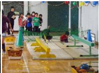
6-3 ヤナリンピック2012 レッツ トライ！