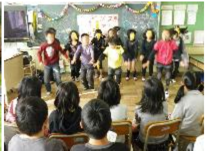
4-3 ダンス おわらい げき