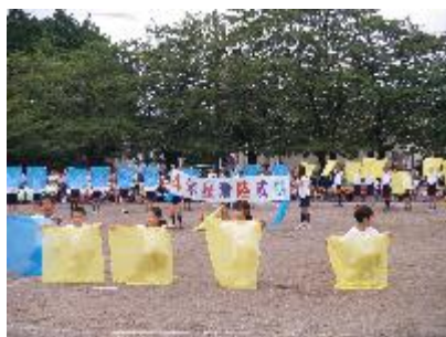
宇宙(そら)! みつけた(4年)