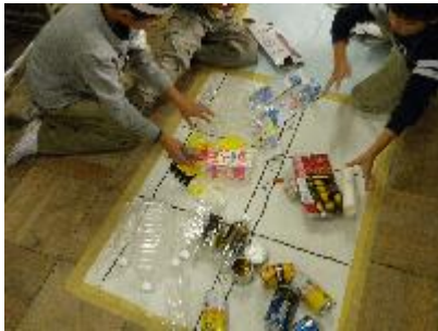
4-1 学ぼう！楽しもう！4の1 防災ゲーム、分別ゲーム