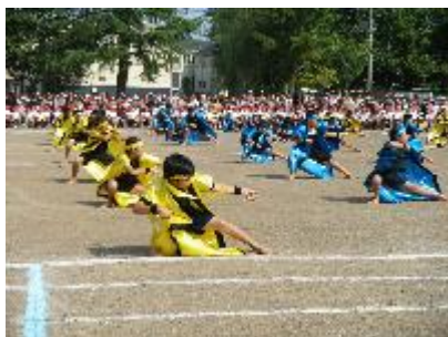
柳小(やな小)ソーラン ～心の宝物～(6年)