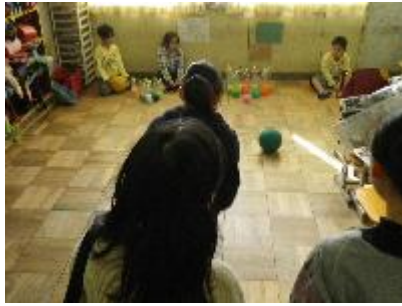
3-2 ボウリング たからさがし