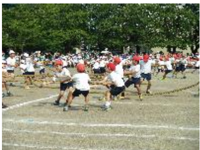
とびつけ! ひっぱれ!(3年)