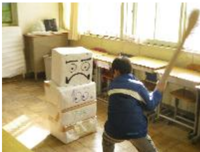
5-1 楽しみを運ぶよ5の1サンタ きよ大ダルマおとし、うでずもう