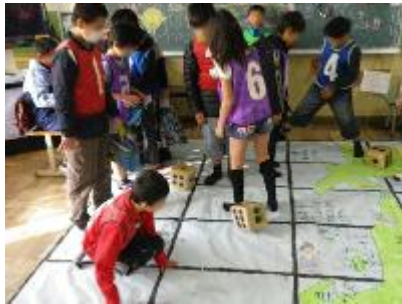
4-2 日本一周りよう いってきま〜す！ 〔けいひん〕松ぼっくりツリー、 どんぐりの顔 など