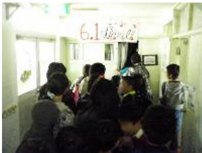
6-1 6, 1 thrill =スリル=