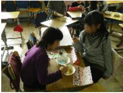
3-1 たのしくわくわく あたまをはたらかせよう スゴロク、大豆のつかみどり