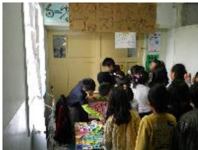
6-2 あなたはゴーストバスター