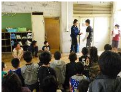
5-2 おもしろい！ げきじょう、ストラックアウト、 スタンプラリー