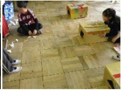
3-3 ふしぎなアドベンチャー ゲームが3こもあるし、 けいひんもいっぱいあります。