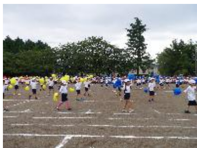
みてみて☆こっちっち(1年)