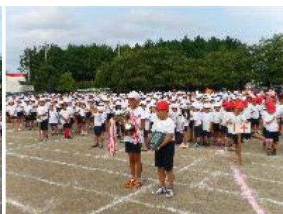
優勝杯・準優勝盾授与