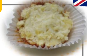
シェパーズパイ (イギリス料理)