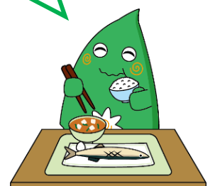
モグモグヤマトン